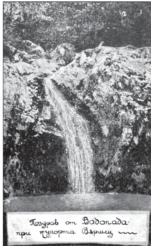
Тездрав от Водопада при курорта Вършец