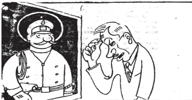
Въру в Елва > Бога Всемогущаго.

По случай Деня на книгата Министерският съвет е решил да се започне изплащането на заплатитъ само на книга.