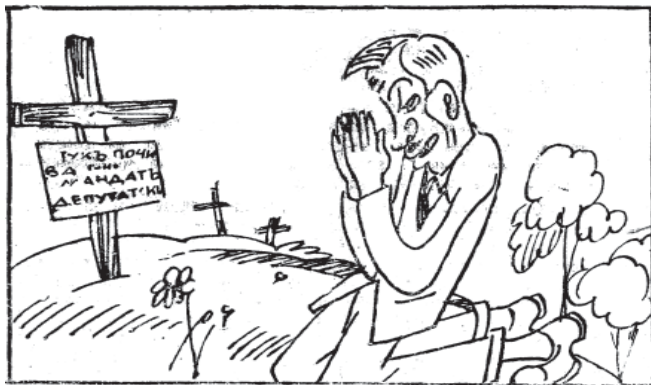
Чаю воскресние мертвихъ