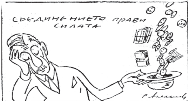
И жизни въ будущаго парламента — амизи