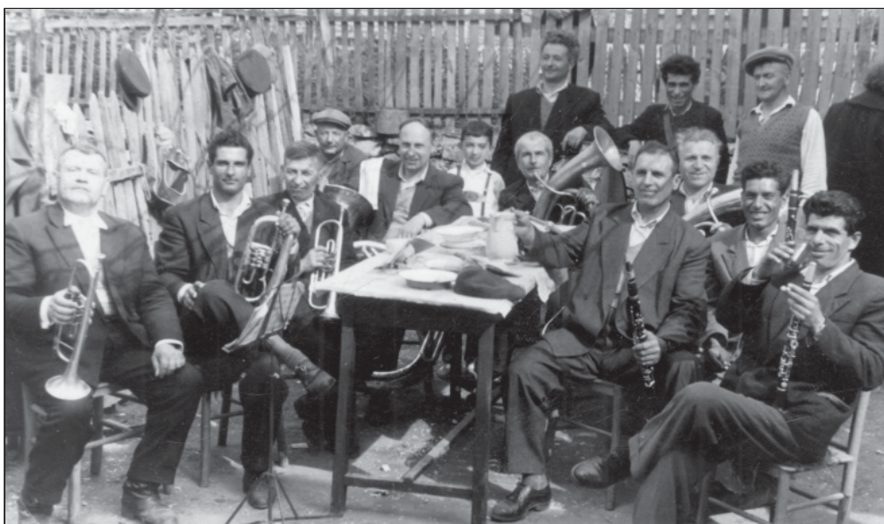
Оркестър за избори, сватби и погребения